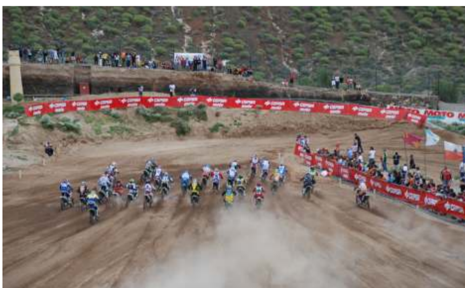
La llegada a la primera curva, tras la salida, es un momento de alta tensión