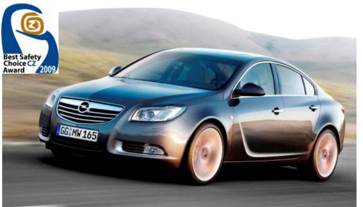
El Instituto de Investigación sobre Reparación de Vehículos ha otorgado al Opel Insignia el premio "Best Safety Choice"