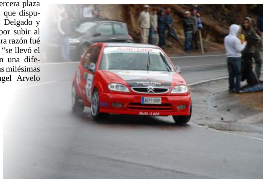
Antonio I. Díaz fue el mejor en la Copa Saxo a más de catorce segundos de Moisés García