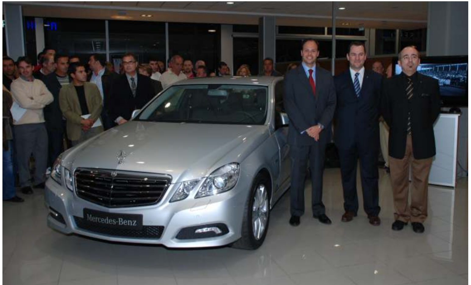
El nuevo modelo presentado levantó una gran expectación

¡Hacemos ganar dinero a nuestros clientes!