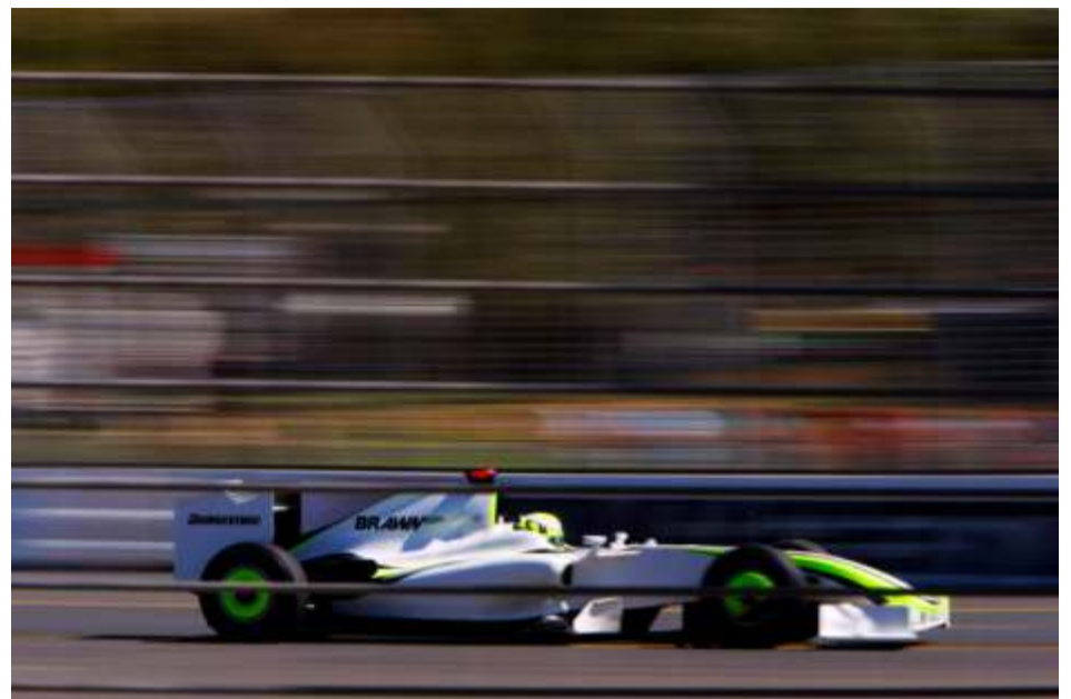
Jenson Button no tuvo rival y se proclamó vencedor del GP de Australia de F1 2009