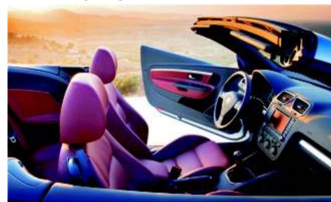
El elegante interior posee asientos con tapizado en cuero Viena