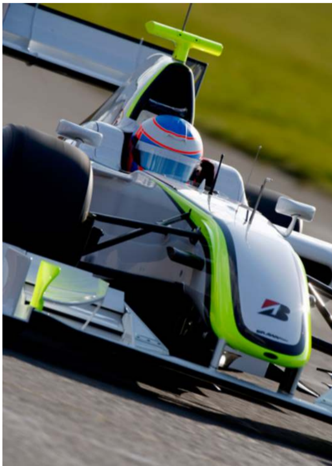
Honda, tras mucho trabajo, no consiguió resultados. Brawn GP arrasó

En la primera carrera de la temporada celebrada en Australia, tras unos entrenamientos en los que dejaron ver lo que se venía encima, confirmaron los pronósticos y acabaron en primera y segunda plaza de un podio, desde hacía mucho tiempo, poco habitual.