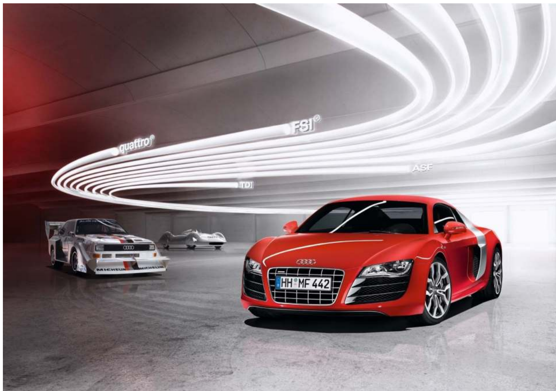
En 1980, Audi lanzó al mercado el primer modelo de producción en serie con la tracción a las cuatro ruedas, que denominó quattro