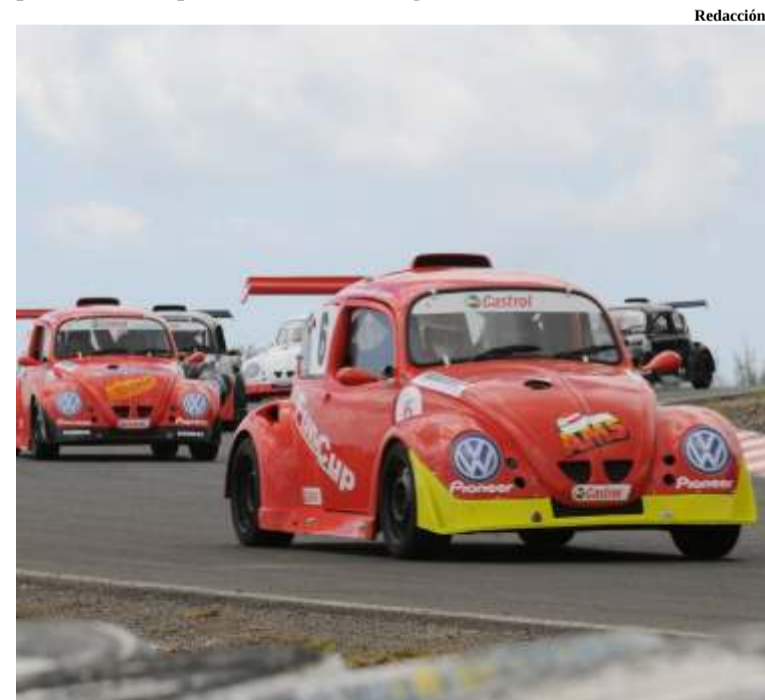
La VW Fun Cup siempre emocionante, divertida y segura

A falta de 10 minutos la cabeza de carrera estaba separada sólo por 34 segundos con respecto al segundo clasificado, poniendo la victoria en juego en las últimas vueltas.