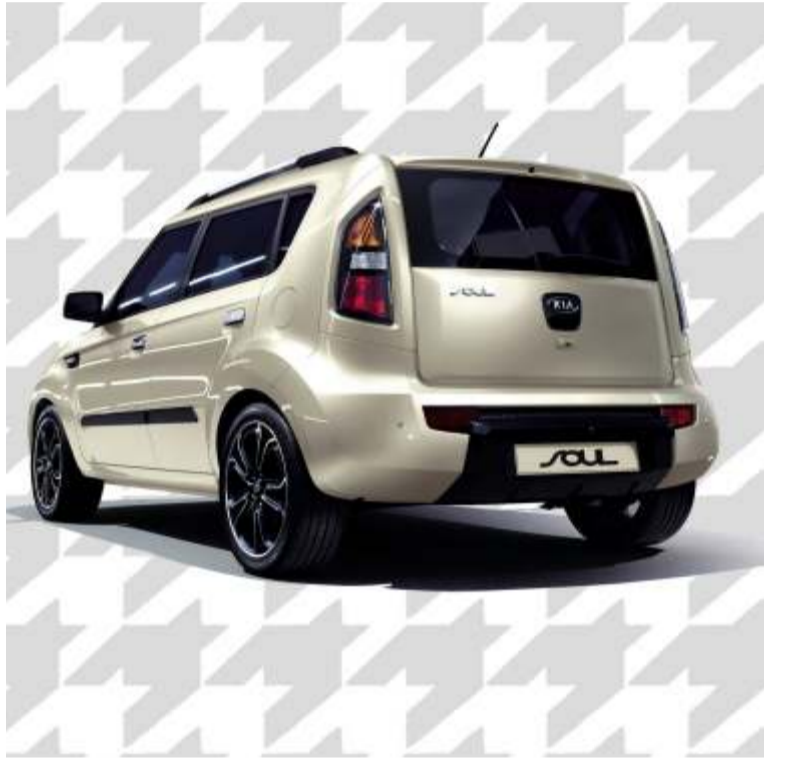
Es innegable la originalidad del diseño del Kia Soul