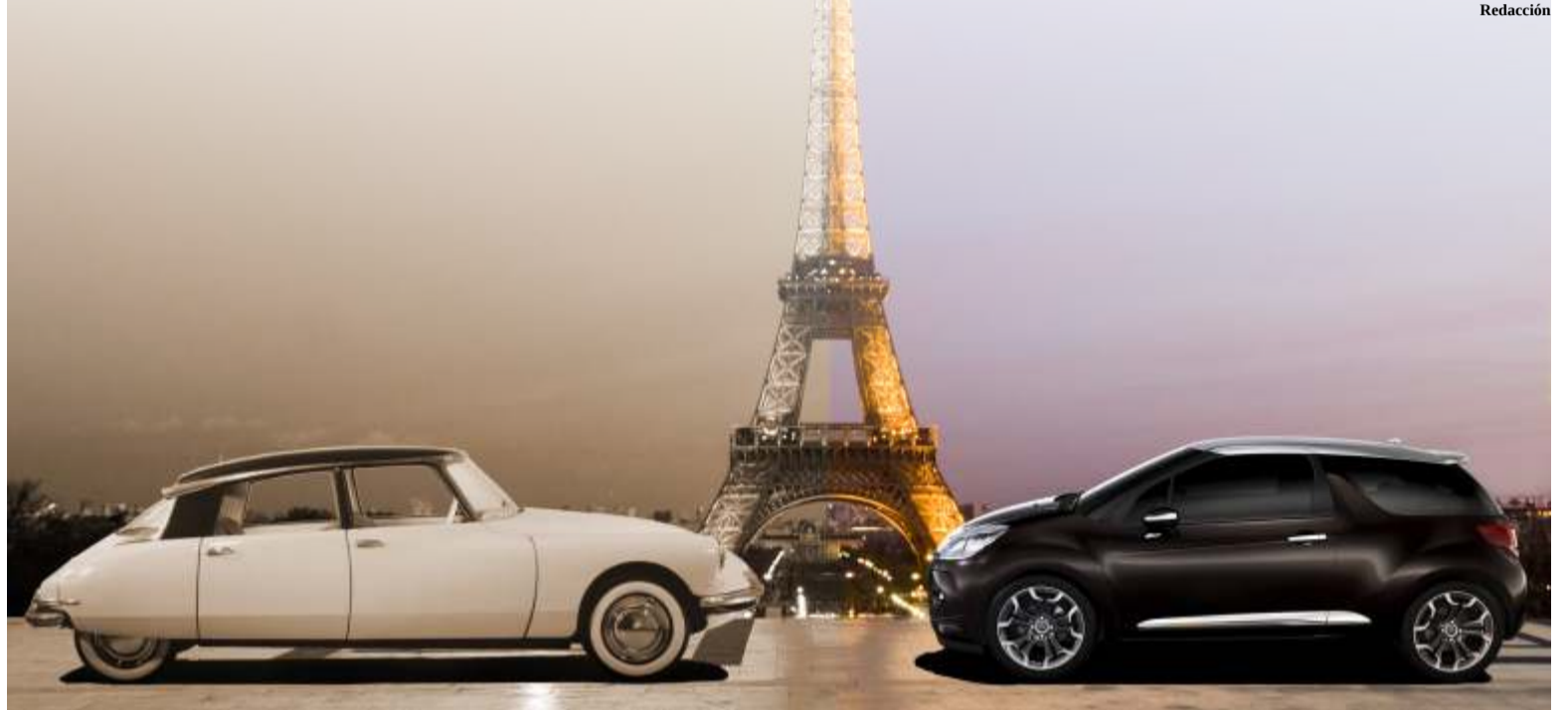
El Citroën DS ha sido galardonado como “Coche más bello de todos los tiempos” , coincidiendo con el lanzamiento de la gama DS, de productos disitntivos de la marca