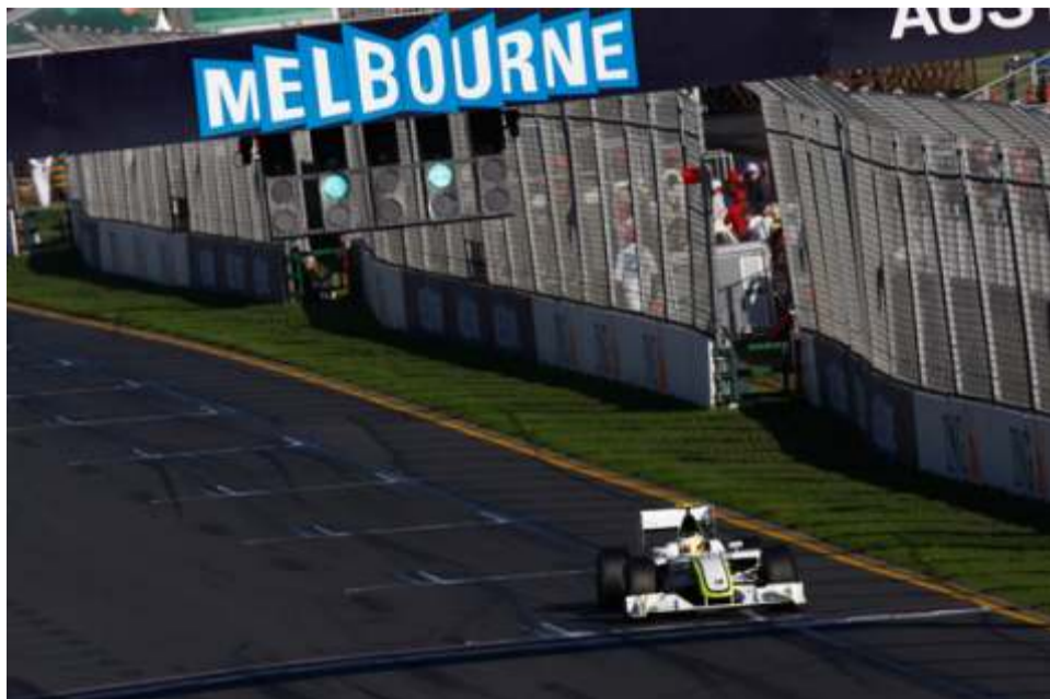
“Por culpa o por gracia del difusor” lo cierto es que los Brawn arrasaron