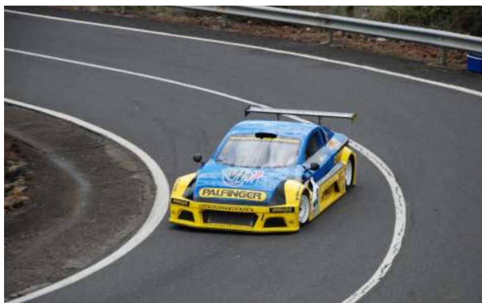
Pedro J. Afonso fue el más rápido en barquetas