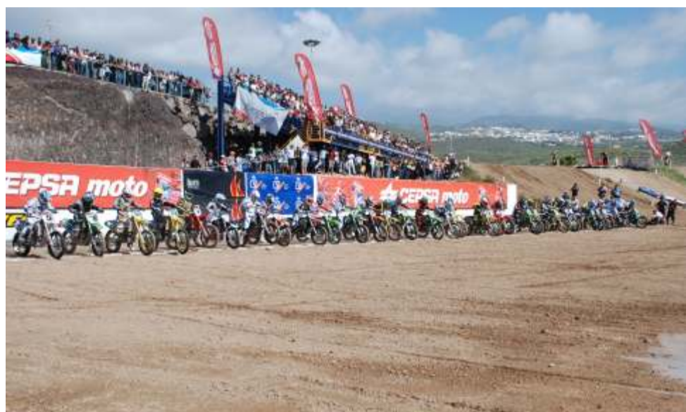
Todos los participantes estuvieron encantados y coincidieron en sus alabanzas al circuito