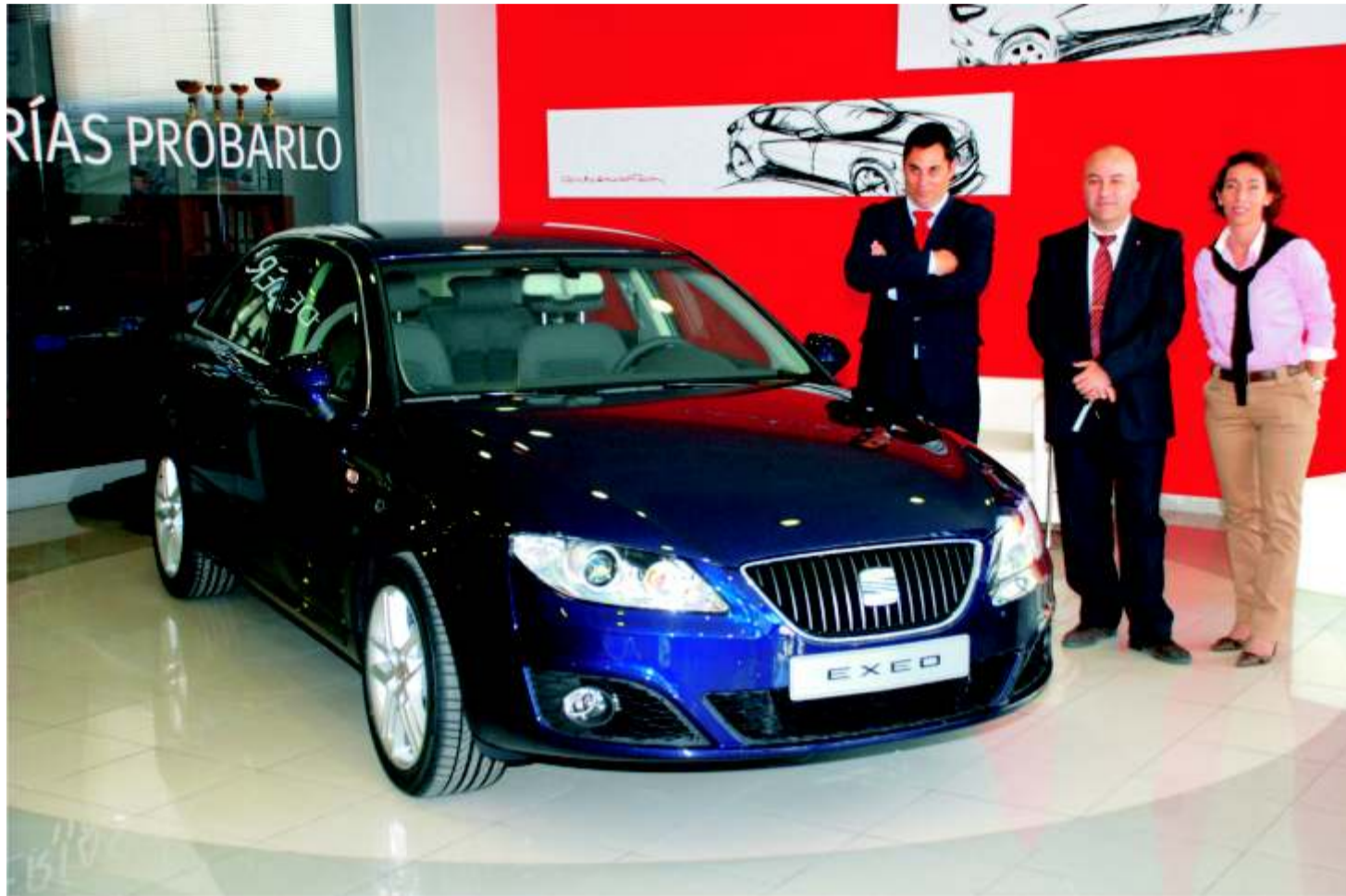
El Exeo viene a cubrir un hueco que completa la gama de producto de Seat

Tras unos días de suspense, ya que se encontraba en las exposiciones oculto bajo un guardapolvo, la prensa y todos los clientes tienen a partir de ahora la posibilidad de ver, curiosarse e incluso comprar el nuevo buque insignia de la marca española.