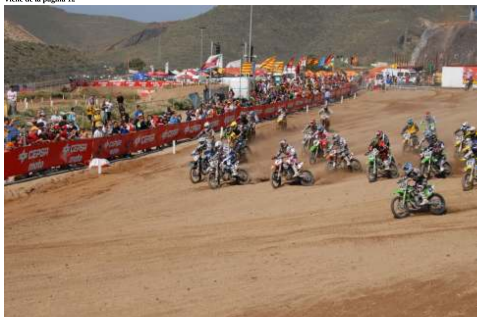
Espectacular salida de una de las tres mangas de MX Elite