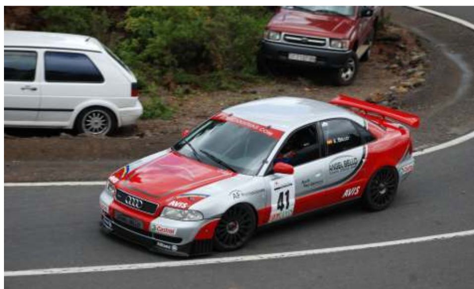
Impecable el aspecto del Audi A4 ST de Ángel Bello