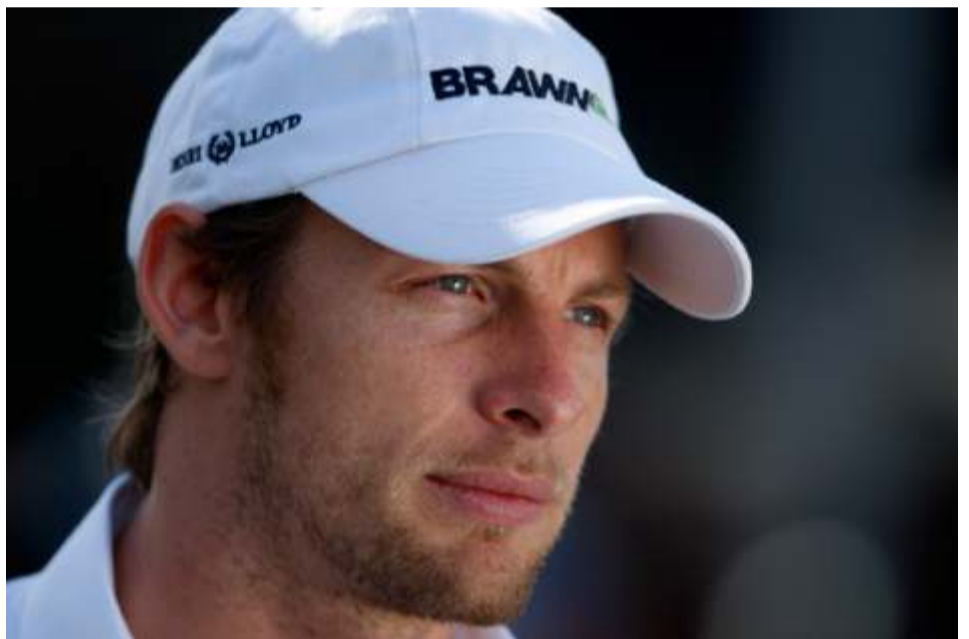
Jenson Button, que estaba a punto de “ir al paro” se encontró con una merecida victoria