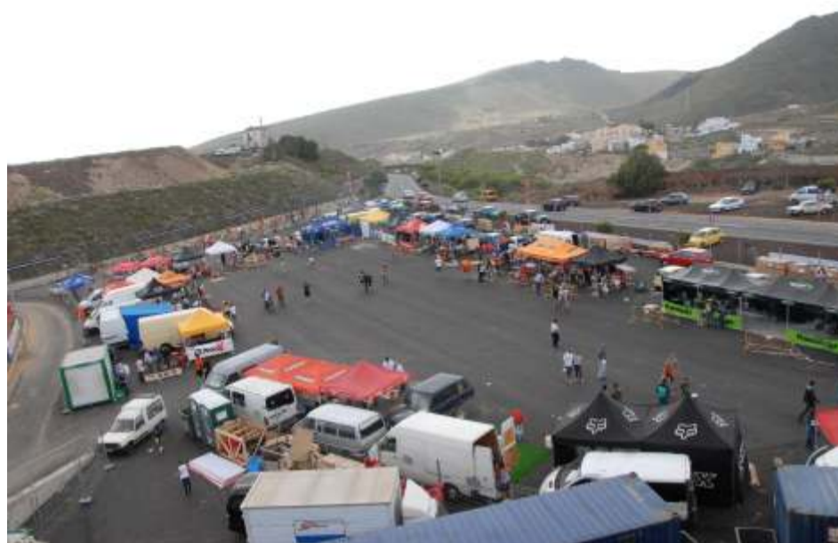
El paddock asfaltado del circuito de San Miguel presentaba un aspecto magnífico