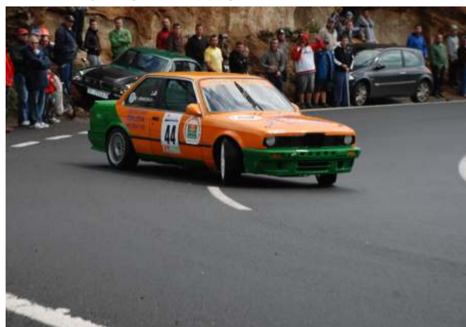
Armando Díaz siempre espectacular