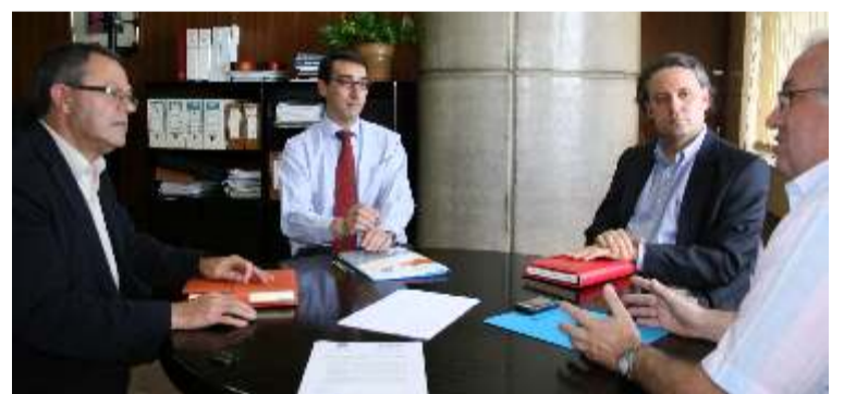
Asintra con el Director General de Industria del Gobierno de Canarias

Durante la mencionada reunión, la Asociación Industrial de Talleres de Automóviles de la provincia tinerfeña lamentó los retrasos y colapsos que provoca la cita previa para solicitar la revisión en las ITV. Para arreglar ese problema, reclamaron como necesario que las concesionarias de las ITV inviertan con urgencia en la ampliación de sus infraestructuras y en optimizar sus líneas de comunicación, tanto por vía telefónica como por internet.