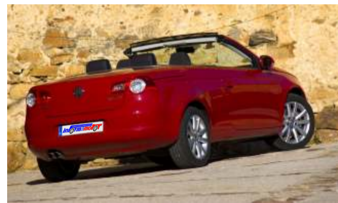
En tan solo 25 segundos podemos "cambiar de coche"