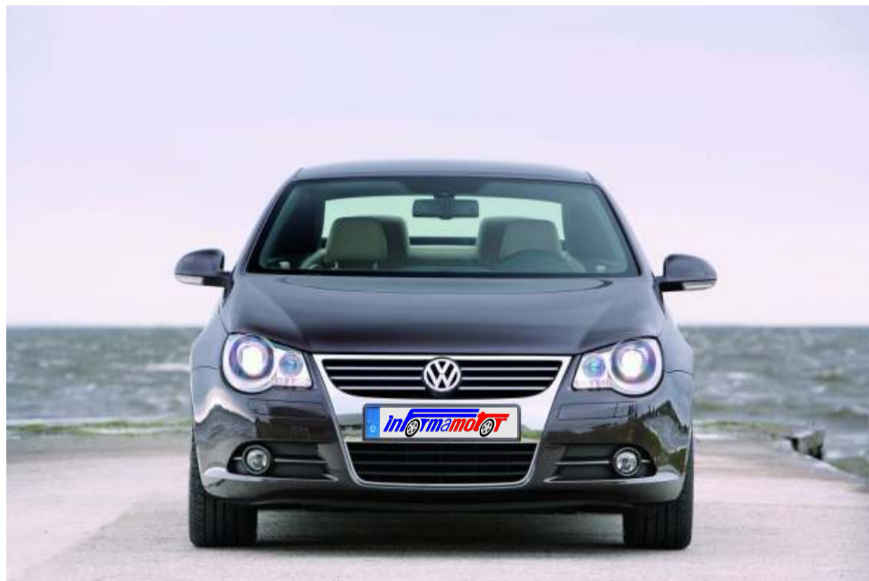
El Volkswagen Eos, aunque ya es familiar en las carreteras canarias, está ahora disponible, en la versión Style, con muchas mejoras