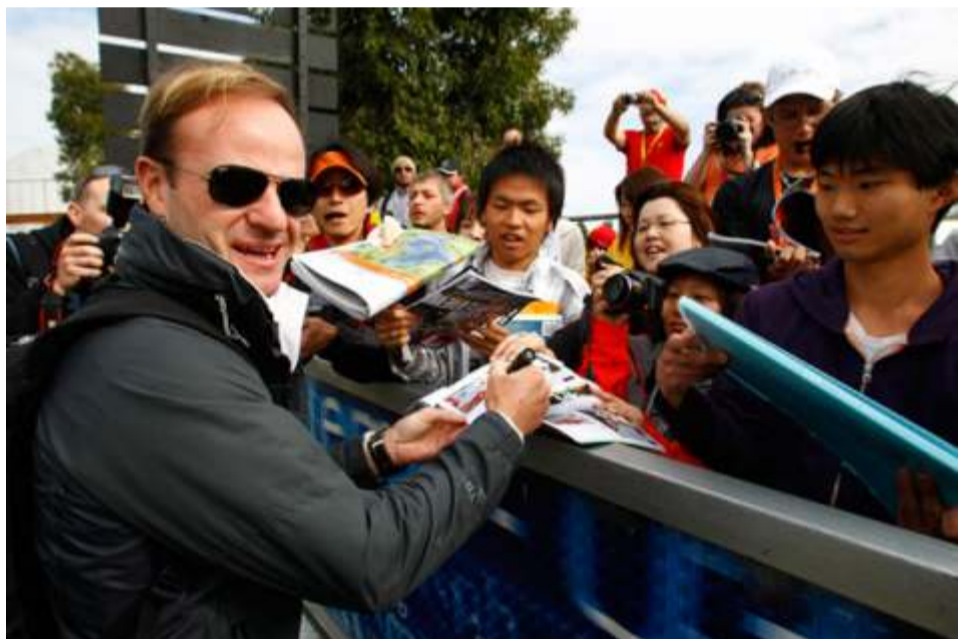
Rubens Barrichello volvió a subir al podio después de muchísimo tiempo