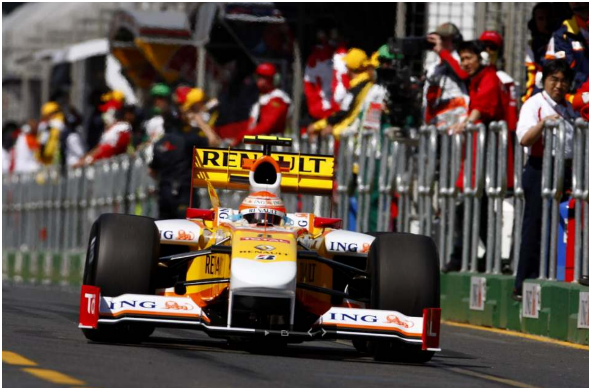
Un sexto puesto que se convierte, por el problema de Trulli con Hamilton, en un quinto y cuatro puntos. Para empezar, y después de lo visto, puede estar bastante bien.