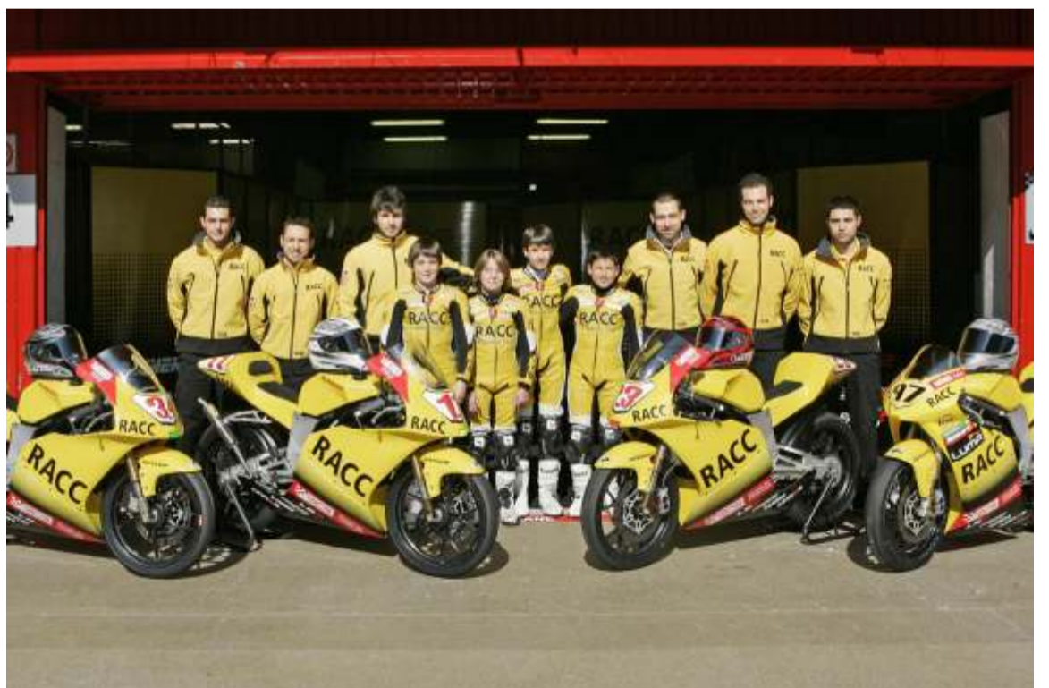
El RACC continúa esta temporada su labor de promoción de jóvenes pilotos