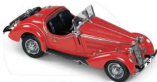
Wanderer W 25 K

Auto Union AG duró 16 años; no obstante, a causa de la guerra, el consorcio sólo dispuso de siete años para innovar y expandirse. De este período quedan para la historia más de 3.000 patentes dentro y fuera de Alemania. Uno de cada cuatro automóviles matriculados en Alemania hasta 1.938, entre ellos varios modelos de lujo, procedía de Auto Union. En 1.936, Wanderer todavía sacó al mercado un coche deportivo muy interesante, el W 25 K, destinado a hacerle la compe-